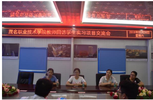
走访顶岗实习企业和学生