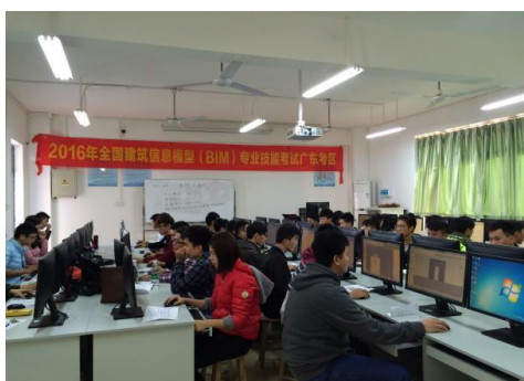
建筑信息模型实训