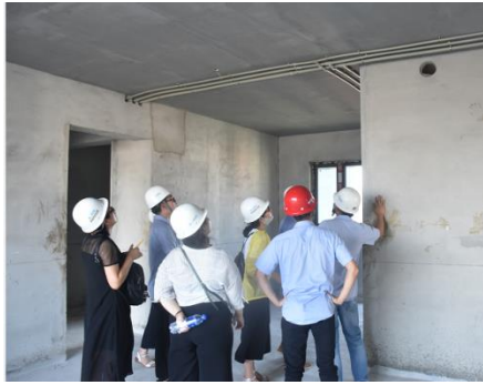
工程监理实习现场