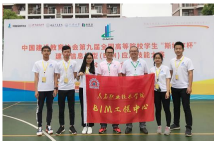
建筑信息模型应用技能大赛