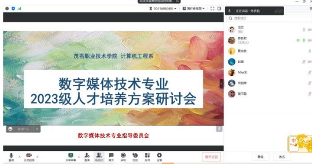
数字媒体技术专业指导委员会参与 2023 级人才培养方案的制定