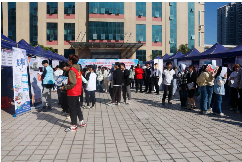
北校区招聘会现场

当天下午,各系部分别在年会分会场举办校企合作交流会、各专业人才培养方案研讨会、专题讲座、实训室参观、订单班宣讲等活动。