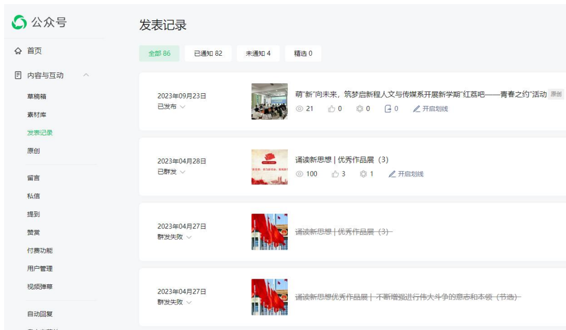
图 1：红荔吧公众号关注人数达 1558 人，发表内容 86 条。

“红荔吧”创办于 2019 年 5 月，坚持以习近平新时代中国特色社会主义思想为指导，立足于落实立德树人的根本任务，是一个集思想政治教育、释疑解惑和实践协同育人平台。构建以“红荔吧”为平台，以红荔 TV、红荔吧公众号、红荔社学生社团为载体，以红荔班级、红荔宿舍、红荔标兵、红荔志愿服务队、红荔新生训练营等为抓手的“红荔”系列品牌活动，以丰富的教育活动载体，灵活的组织形式、喜闻乐见的活动内容，陶冶了学生情操、提升了学生品质、塑造了学生灵魂，构建实践协同育人平台，打造“三全”育人体系。