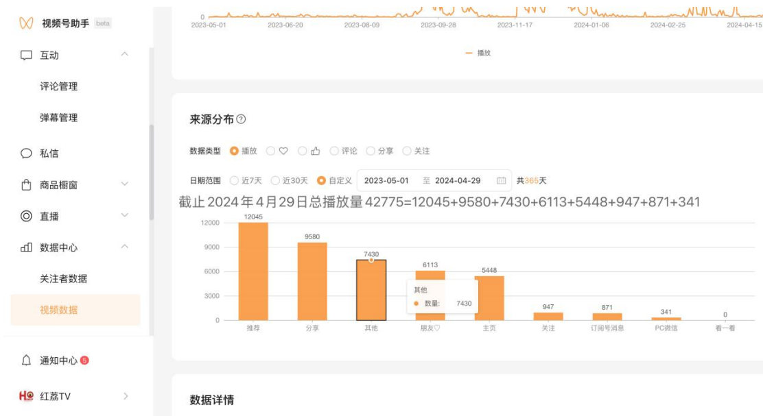
图 3: 红荔 TV 2023 年 5 月至今点击量达 4 万多次