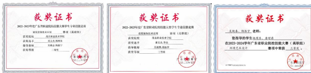
图 2 学生技能大赛获奖

(2) 学生创新能力得到提升, 技能大赛获奖, 学生能力得到认可 (见: 图 2)