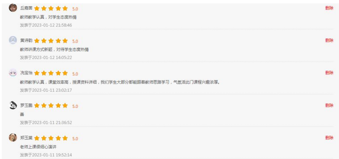
图 1 学生超星平台对课程满意度评价意见

(2) 学生创新能力得到提升, 技能大赛获奖, 学生能力得到认可 (见: 图 2)