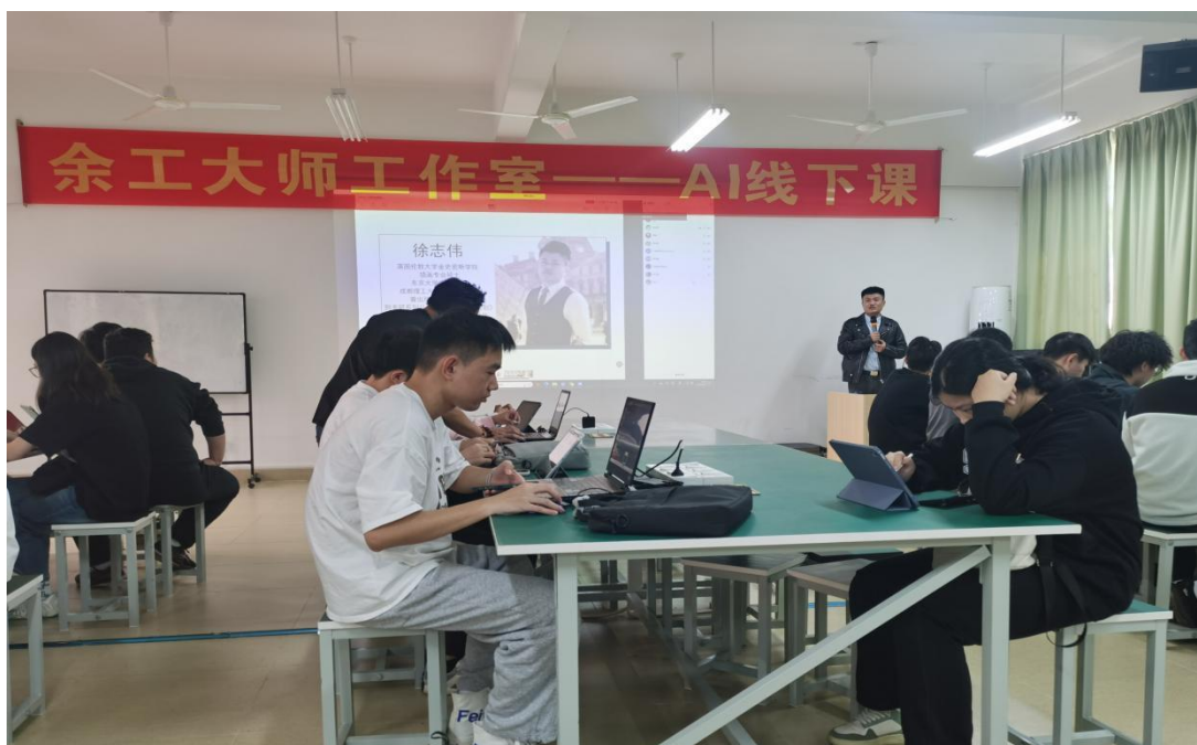
图 17：余工大师工作室 AI 线下课