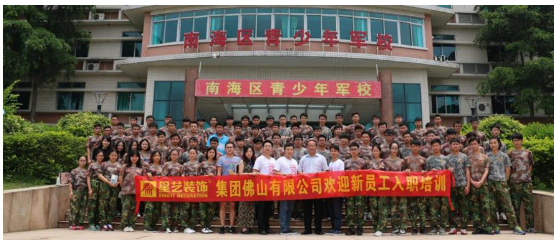
图 6：学生到星艺集团岗位实习