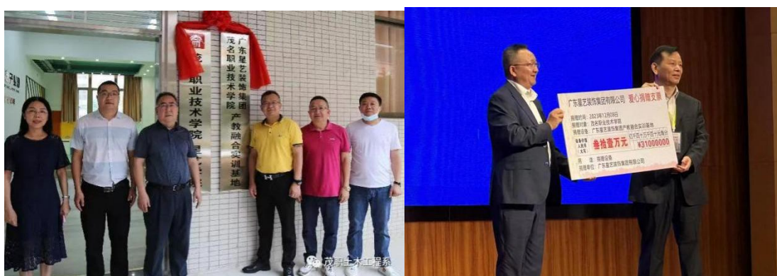
图 10：广东星艺装饰集团产教融合实训基地捐赠、揭牌仪式

广东星艺装饰集团有限公司投入 31.3 万共建茂名职业技术学院广东星艺装饰集团产教融合实训基地，基地见证校企深度协同，学校揽实践资源赋能教学，企业获科研动力驱动创新。师资交流碰撞智慧火花，实训基地多元拓展功能，既为行业培育栋梁，又为发展孕育新技术，携手踏上荣耀征途，铸就校企合作丰碑。广东星艺装饰集团有限公司并被学院授予“优质合作企业”的荣誉。