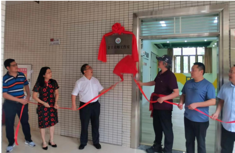
图 12：余工大师工作室揭牌仪式

成立余工大师工作室，为校企合作再添华彩。余工携多年行业沉淀入驻，以前沿视角剖析设计美学。学生近水楼台，参与高端案例研讨，从空间意境塑造到人文关怀融入，汲取创作精髓，在大师熏陶下，点亮设计灵感，开启非凡创意之旅。