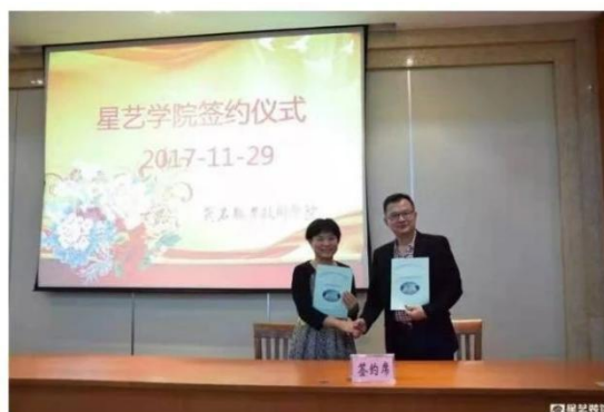
图 2：茂名职业技术学院——星艺学院签约

本着“资源共享、优势互补、互惠互利、共同发展”的理念，于2017年11月，广东星艺装饰集团有限公司与茂名职业技术学院签订了长期战略合作协议，共同创建星艺学院。依托高校的人才和科研优势，通过专业共建、人才培养、课程体系建设等方面深度融合，在技术研发、技术创新等方面展开全方位的合作，已逐步形成优势互补、产研结合、成果共享、共同发展的模式：