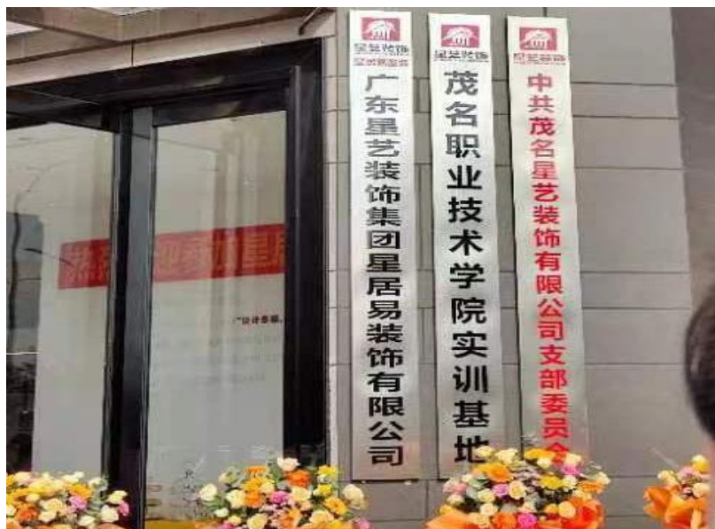
图 9：广东星艺装饰集团建筑室内设计专业校外实践基地