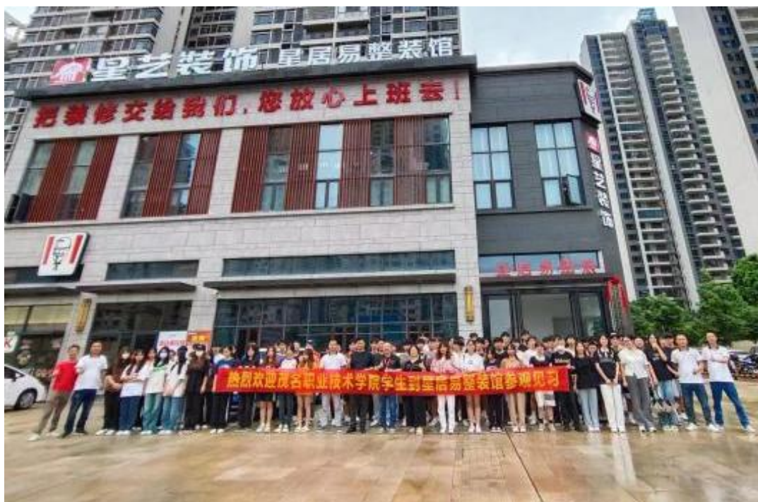
图 4：学生到星艺集团认识实习