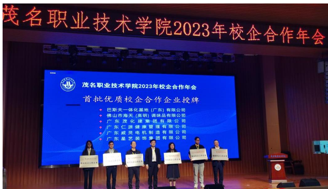
图 11：首批优质合作企业授牌