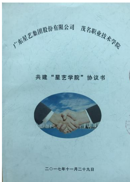
图 18：校企合作协议书（1）