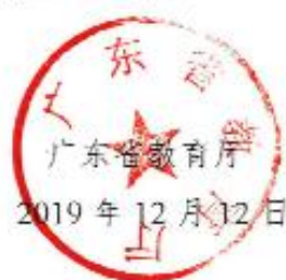
图 7：获省教育厅认定省级校外实践基地文件（1）