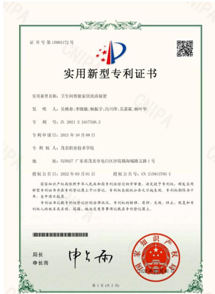
图 15：与企业合作获得专利证书