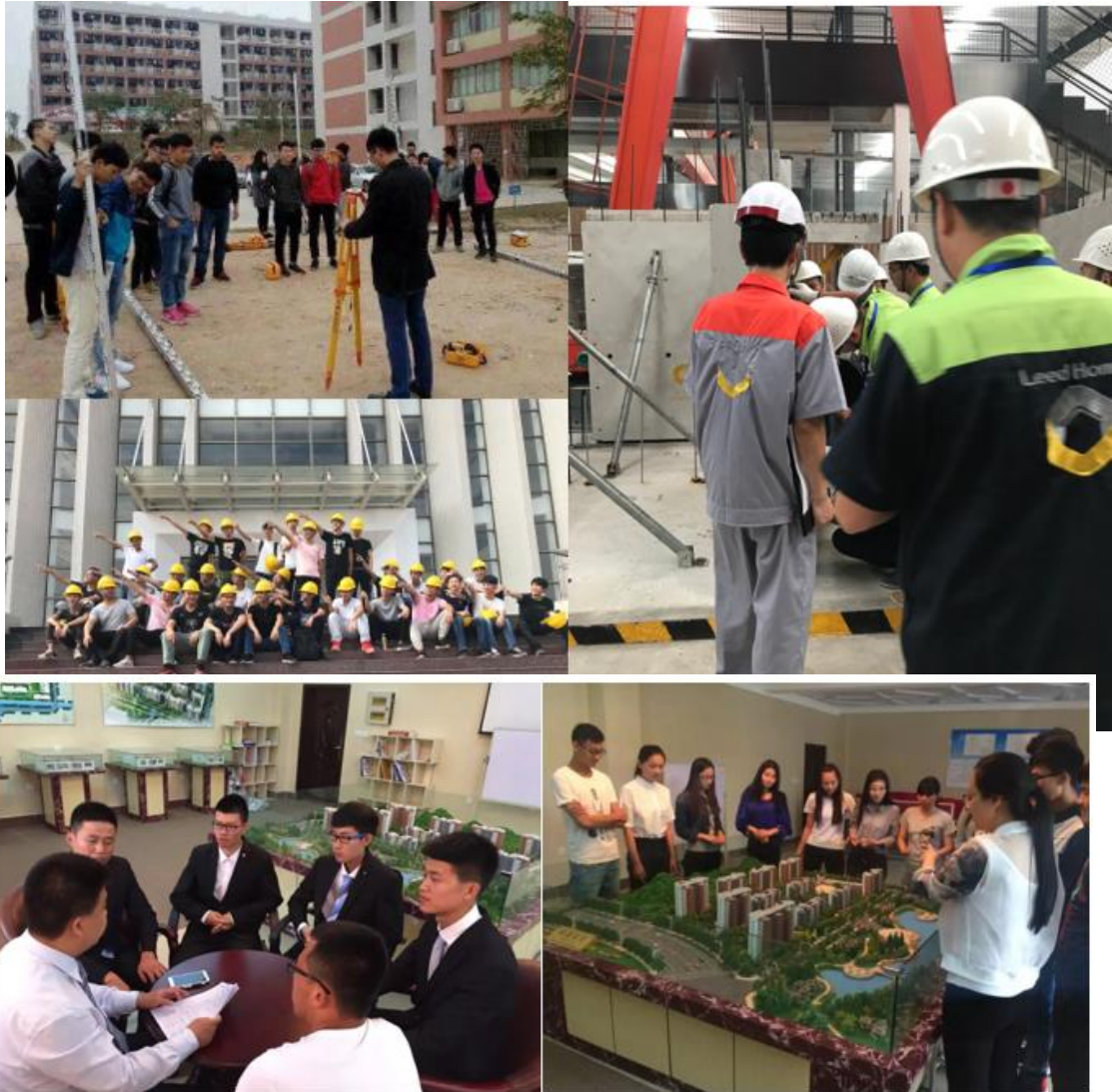
房地产实践教学现场