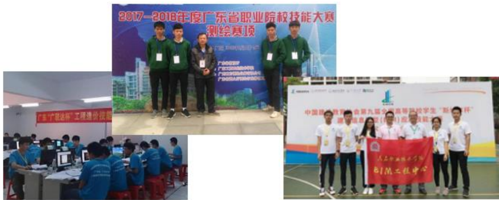
学生参加技能大赛